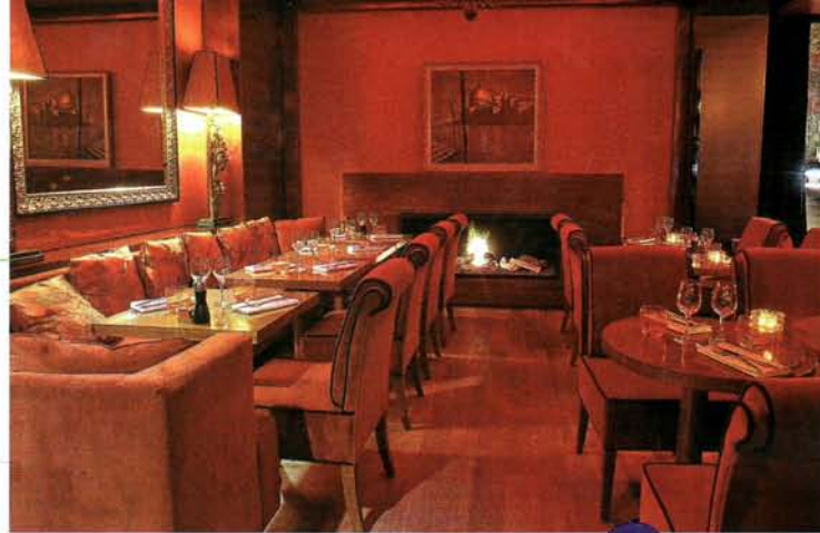
Cocooning garanti au Casa Luna...

Exit le Cap Vernet face à l'Etoile, superbement remplacé par le Casa Luca. Esprit très glamour et cosy sur les fauteuils et canapés cossus. Idéal pour un fête-à-fête le soir sous les lumières tamisées et musique d'ambiance. Même dans la petite salle du fond avec son plafond à la feuille d'or, Pierre-Yves Rochon a joliment griffé cette nouvelle adresse qui joue une Italie de charme très déstressante. D'autant plus que la cuisine de Giovanni Perrone (ex-Viaggio) est d'une remarquable sincérité et qualité. On est sur la route du bonheur avec la pizzetta Margherita très fine et goûteuse, le carpaccio de bœuf comme à Venise ou carpaccio d'espadon à l'huile d'olive et citron, les linguine aux palourdes, les gnocchi